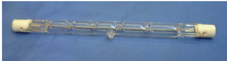
Ampoule halogène linéaire 300 W / 230 V

Donc ces ampoules halogène ont une forte perte d'énergie sous forme de chaleur. Mais leur avantage indéniable est leur degré de luminosité et une certaine longévité. C'est-à-dire que proportionnellement à leur consommation de courant électrique, elles fournissent une lumière plus éclatante que les ampoules à incandescence simples.