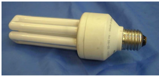
Ampoule à faible consommation ↑