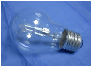
Ampoule halogène 60W / 230 V protégée par globe en verre

lequel réagit avec le filament, mais régénère constamment celui-ci par son action chimique sur le tungstène. L'iodure de tungstène formé se dépose par sublimation sur la paroi de l'ampoule et revient ensuite redéposer le tungstène sur le filament. La paroi de ces ampoules est en quartz car la température interne dépasse dans certaines circonstances la température de fusion du verre (le quartz a un point de fusion compris entre 800 et 2000 °C alors que le verre ordinaire se ramollit déjà à 550 °C).