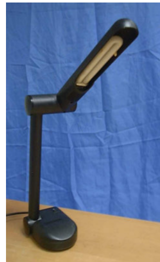
Lampe de bureau à faible consommation →

Tous ces tubes et ampoules "économiques" contiennent entre 3 mg et 46 mg de mercure (*) par luminaire.