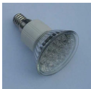
LED's groupées de 2 ème génération (décoration)