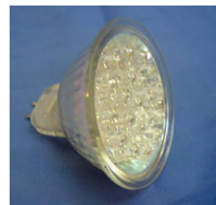
LED's groupées de 2 ème génération en basse tension 12 V