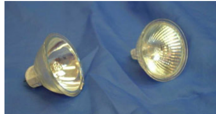
Ampoules halogène 50W / 12 V