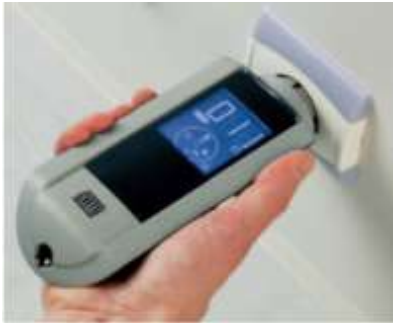
Appareil de mesure d'impédance de terre Catohm