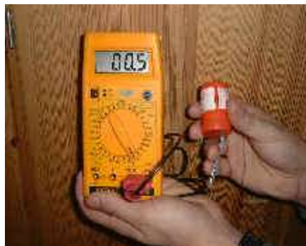
Appareil de mesures des champs magnétiques 50Hz (EFM-130, USA)