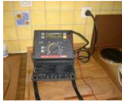
Appareil de mesure de précision d'impédance de terre NORMA,