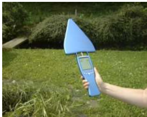
Le SPECTRAN HF 6080 tenu à la main

L'ESMOG SPION appareil de poche extrêmement sensible destiné à l'évaluation rapide du niveau global de pollution à hautes fréquences →