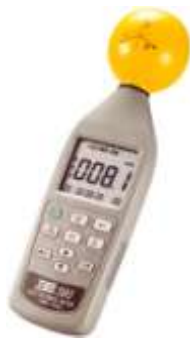
Appareil de poche Electromog Meter TES 593